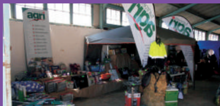
TRA Uniondale se Wen stalletjie by die Uniondaleskou