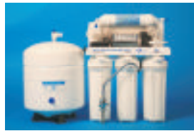
Whole House Filters