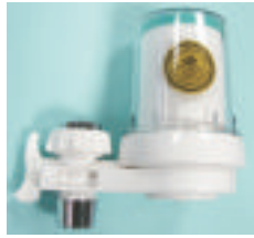
KITCHEN FAUCET MOUNTING CERAMIC FILTER