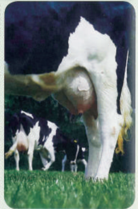
Comparison of milk yield in long and short dry period lengths

The ultimate goal of the dry period is making sure that on the day of calving the udder and cow are in the best physical condition for a healthy and productive next lactation. Just like recharging the