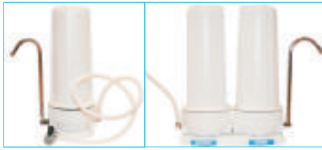
ONE & TWO STAGE COUNTER TOPWATER FILTERS