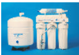
5 STAGE REVERSE OSMOSIS