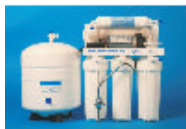
OSMOSIS WATER PURIFIERS