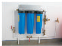
WHOLE HOUSE FILTERS