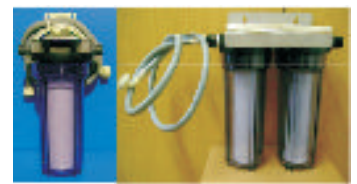
WASHING MACHINE FILTERS 1 & 2 STAGE