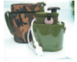
OUTDOOR CERAMIC WATER FILTER- IDEAL FOR CAMPING & HIKING