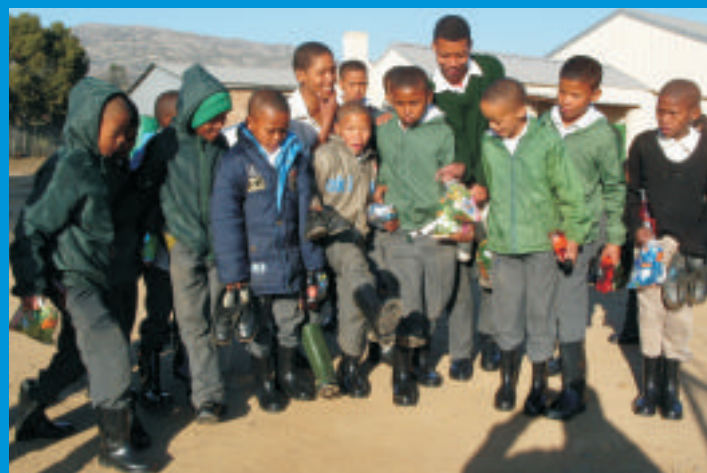
Leerders van Dieprivier Primêreskool spog met hulle nuwe waterskoene