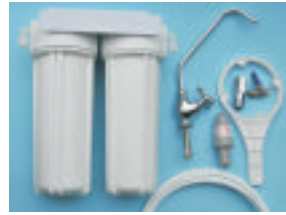
2 STAGE UNDER COUNTER FILTER