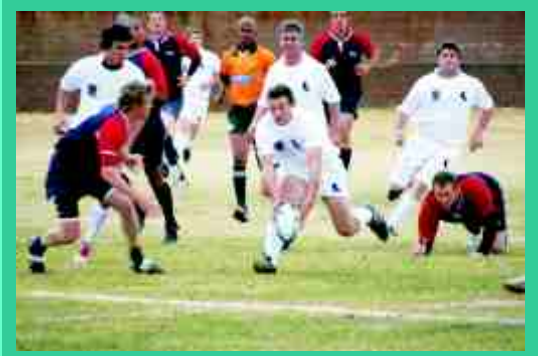
Plaaslike spelers in aksie