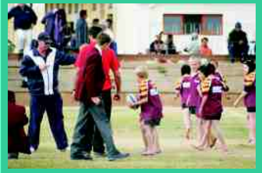
MacLachan te Joubertina